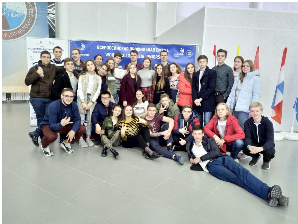
Наш дружный отряд